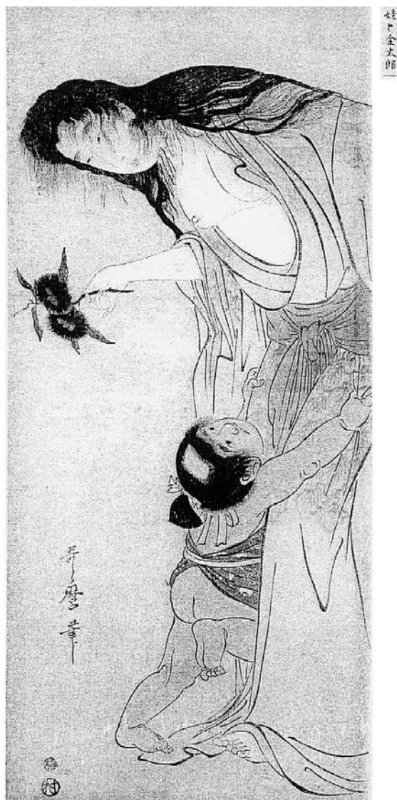
図版1 山姥と金太郎