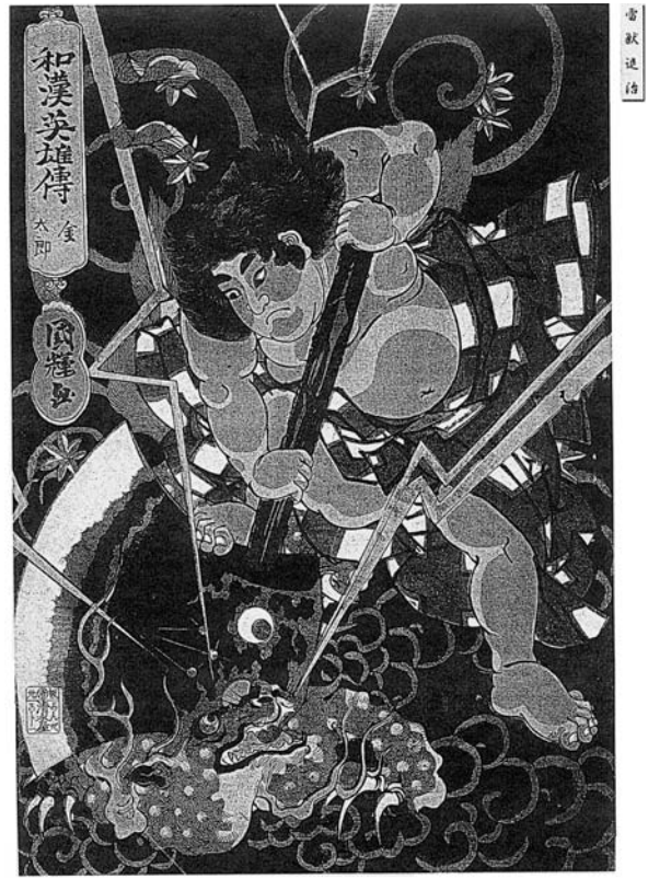
图版 3 和漢英雄傳 歌川国輝，天保中期（1835 年頃）