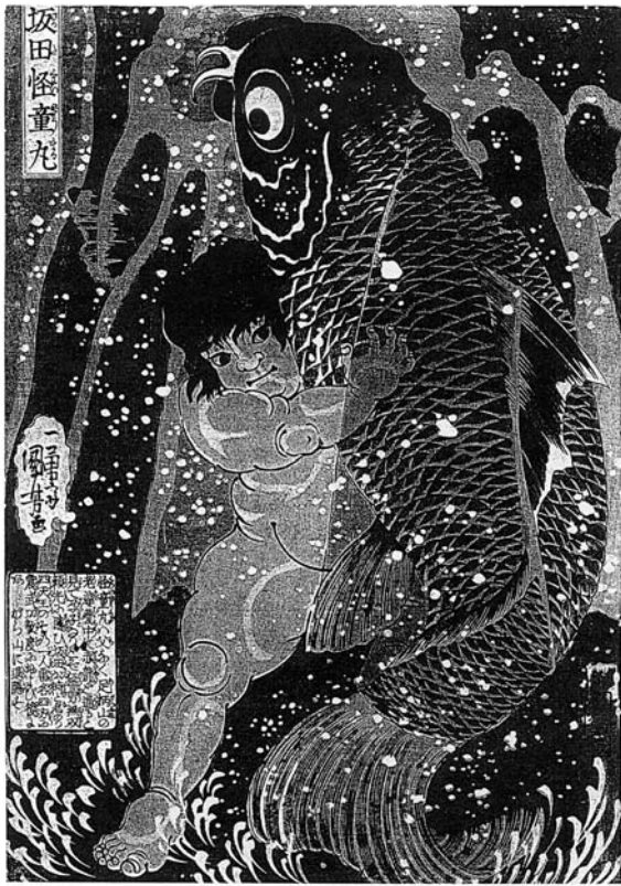
图版 2 坂田怪童丸 歌川国芳，天保中期（1835 年頃）